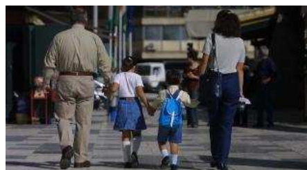
Una familia pasea por una calle del Centro Histórico de Málaga. Arciniega

Las familias numerosas se clasifican en dos categorías: especial y general. La primera es: una familia integrada por 5 o más hijos o hijas; familia integrada por 4 hijos o hijas, de los cuales al menos 3 proceden de parto, adopción o acogimiento permanente o preadoptivo múltiples; y, las unidades familiares con cuatro hijos o