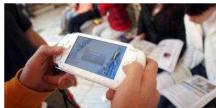
La adolescencia es una edad especialmente conflictiva en los jóvenes y que afecta también a sus familias. La Opinión

MATUCHA GARCÍA. MÁLAGA Agresiones verbales e incluso físicas, incumplimiento de las normas básicas de convivencia, dificultades para la comunicación o problemas escolares. El servicio de mediación familiar e intergeneracional de la Junta de Andalucía intervino en el pasado año en los conflictos de 240 familias malagueñas, según los datos facilitados por la Delegación para la Igualdad y Bienestar Social de la Junta en Málaga.