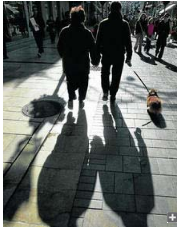
Una pareja pasea por el centro de Málaga con un perro.

Una pareja en proceso de separación ha presentado ante un juzgado de Familia de la capital una propuesta para que se regule el régimen de visitas y estancias del perro de la familia. El convenio propuesto plantea un tratamiento similar al que habitualmente se establece para los hijos menores de la familia, con fines de semana y periodos vacacionales preestablecidos para la mascota una vez disuelta la convivencia. Sin embargo, el juez ha rechazado el convenio. Esta es una de las primeras resoluciones judiciales que se conocen en Málaga sobre la situación en la que quedan los animales domésticos tras la separación de las parejas. Hasta ahora se han producido varias sentencias en España relacionadas con divorcios y mascotas y, por el momento, los pronunciamientos de los jueces han tomado direcciones opuestas.