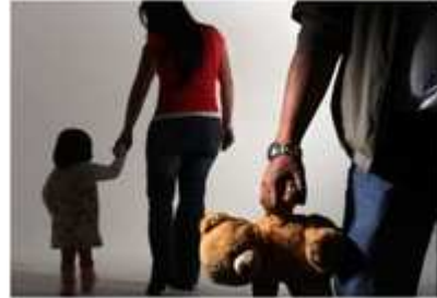
La custodia de los hijos es atribuida por los tribunales a la madre en exclusiva en el 90% de los casos

El 64,4% de mujeres y el 75,6% de hombres lo consideran así, según un estudio de la ‘Asociación de Abuelos separados de sus nietos’. El sistema y la propia Administración “estimulan” este fenómeno porque hay “ayudas que se conceden por el hecho de denunciar”