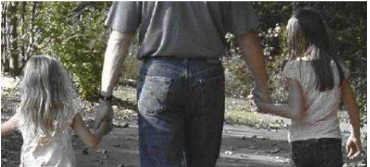
Lo más urgente, encontrar un nuevo hogar.

El Tribunal Supremo estableció el pasado mes de abril que en caso de divorcio la pareja debe hacer frente a la hipoteca a partes iguales.