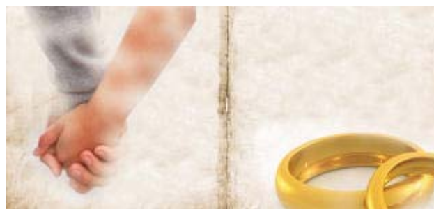
¿Casarse o vivir en pareja?

En relación al tema sucesorio o hereditario, Gil explica que hay una parte no muy bien regulada que es la afinidad. Cuando uno contrae matrimonio, civil o religioso, se contrae una relación por afinidad, entre la mujer y su marido, y los parientes de su marido, con lo cual a la hora de aplicar las relaciones de parentesco determinadas figuras impositivas, como la de sucesiones, se crea una vinculación que permite aplicar determinadas reglas que la simple convivencia de hecho no produce. Es decir, las parejas de hecho, sean formalizadas o no, no crean vínculo de afinidad, sin perjuicio de que algunos impuestos reconozcan la aplicación de los mismos beneficios fiscales a las parejas de hecho formalizadas, mientras que el matrimonio