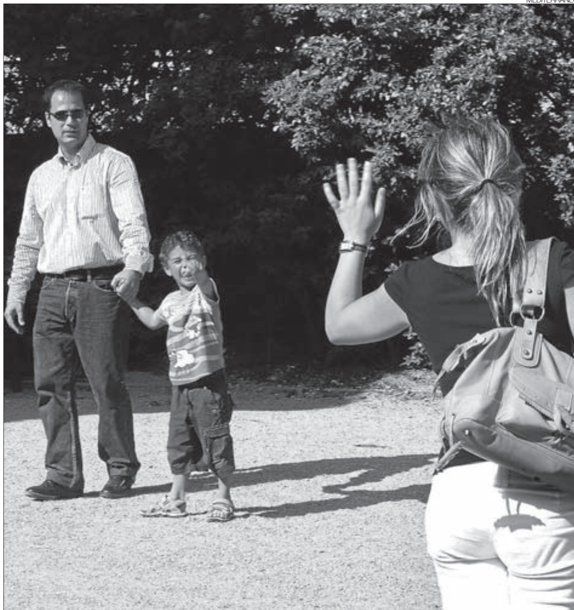
► Aunque es la situación minoritaria, hay parejas divorciadas que comparten al 50% la custodia de los hijos.