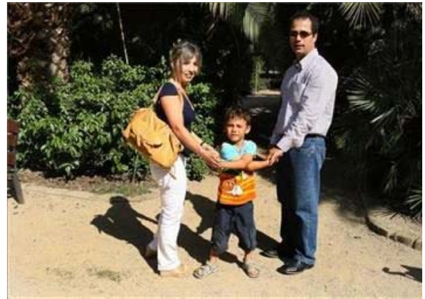
Imagen de una pareja que tiene la custodia compartida de hijo.

El Ayuntamiento de la Vilavella ha aprobado una moción para apoyar la custodia compartida a propuesta de la Unión Estatal de Federaciones y Asociaciones por la Custodia Compartida. El acuerdo contó con los votos a favor del equipo de gobierno popular y los dos ediles del grupo Independents per la Vilavella, mientras que el PSPV-PSOE decidió oponerse.