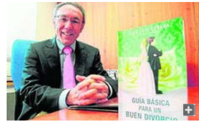
El magistrado José Luis Utrera, pionero en España en promover la mediación judicial en los procesos de familia.

Un tercio de las parejas que inician la separación judicial enfrentados concluyen su relación con un acuerdo amistoso gracias al servicio de mediación intrajudicial, que realizan gratuitamente voluntarios de cinco ONG de Málaga (Soluciona, Mediamos, Intermedia, La Mitad del Cielo y el Centro de Orientación Familiar). Este servicio de los juzgados de Málaga, pionero en España, comenzó a funcionar en 2000 y a partir de 2007 se integró plenamente en el sistema judicial como complemento para favorecer el consenso y el mutuo acuerdo en las separaciones.