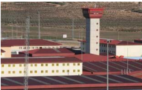
La cárcel de Villena donde ya se encuentra el detenido. JESÚS CRUCES

Posteriormente pudo comprobarse que también había quebrantado, supuestamente, una orden de alejamiento por una denuncia de maltrato de su exmujer.