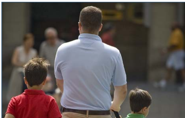
La mayoría de denuncias se dan en Zaragoza.. L. URANGA

El proceso judicial que revisa la cuantía cuando el pagador pierde el empleo se dilata hasta un año. La comunidad registra 500 denuncias al año.