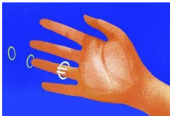
Contra las deudas, divorcio

Los letrados avilesinos detectan un incremento de las divorcios, que en algunos casos vinculan a las consecuencias de la crisis. Según los letrados consultados, las parejas casadas optan cada vez más por las separaciones de bienes, una tendencia que se ha disparado en los últimos años, y también detectan un goteo de divorcios de conveniencia con los que los cónyuges pretenden evitar posibles embargos. En estos últimos casos, el perfil del marido responde a un autónomo con problemas económicos por la crisis. Un estudio realizado por una agencia de investigación e inteligencia constata que el año pasado aumentaron en España un 30 por ciento las investigaciones a parejas morosas que se divorcian antes de declararse insolventes.