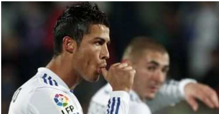
Cristiano Ronaldo dedica un gol a su hijo.

Cristiano Ronaldo se ha visto sobresaltado por una noticia publicada ayer por el diario británico Daily Mail . Según el rotativo, la madre biológica del único hijo del astro merengue quiere recuperar al pequeño al que supuestamente cedió para siempre a cambio de 10 millones de euros.