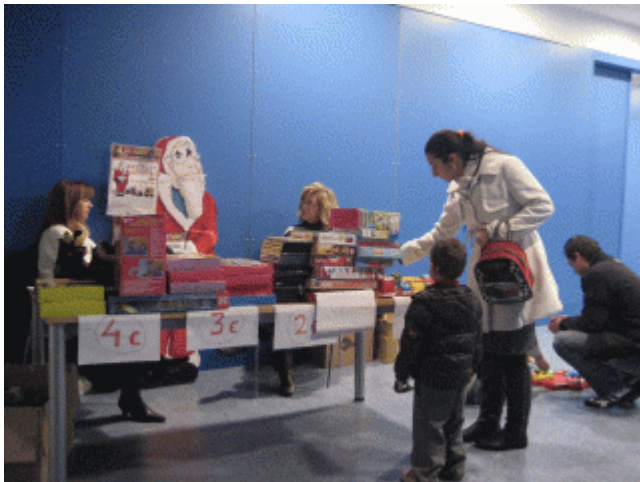
La Asociación de Padres

Aragoneses en Acción alegra la Navidad a los niños del barrio con juguetes en buen estado de sus propios hijos y también nuevos cedidos por otras organizaciones. Los fondos que se recauden por la venta de estos juguetes a un precio simbólico (de uno a cinco euros) se donarán a la Asociación de Padres de Niños Oncológicos de Aragón (ASPANOA). El Rastrillo de Juguetes permanecerá abierto hoy de 17,30 hasta las 20:00 horas en el Centro Cívico Oliver-Valdefierro.