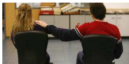
Las parejas en proceso de divorcio o separación son las que menos índice de éxito obtienen con la mediación familiar.

Se trata de una cantidad baja si se tiene en cuenta que esta prestación lleva medio año en funcionamiento y que a estas alturas, según las primeras previsiones que se realizaron desde el Colegio de Abogados de Alicante, se tendrían que haber resuelto el doble de casos. Lo cierto es que el número de asuntos derivados por los juzgados de familia entra en el cómputo de lo que se había estipulado, pero no así el número de conflictos resueltos. Esto impide obtener resultados en lo que se considera uno de los principales objetivos de la mediación: la reducción de la carga de trabajo.