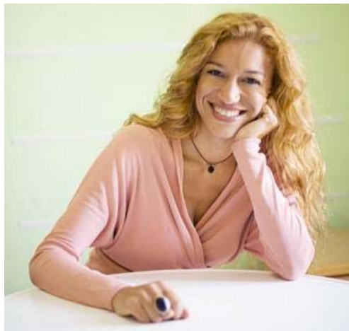
Coca, en una imagen reciente.

IBIZA | ALBERTO FERRER Arantxa Coca es una cara bien conocida en la televisión, donde ha participado en programas como 'Terapia de pareja' o 'Operación triunfo'. Además, ha escrito varias obras centradas en el efecto de la separación de los niños y en cómo pueden verse manipulados por sus padres, llegando a caer en el denominado síndrome de alienación parental (SAP). Esta noche en Santa Eulària desvelará cómo lograr lo contrario: asegurar un crecimiento emocional saludable en los menores.